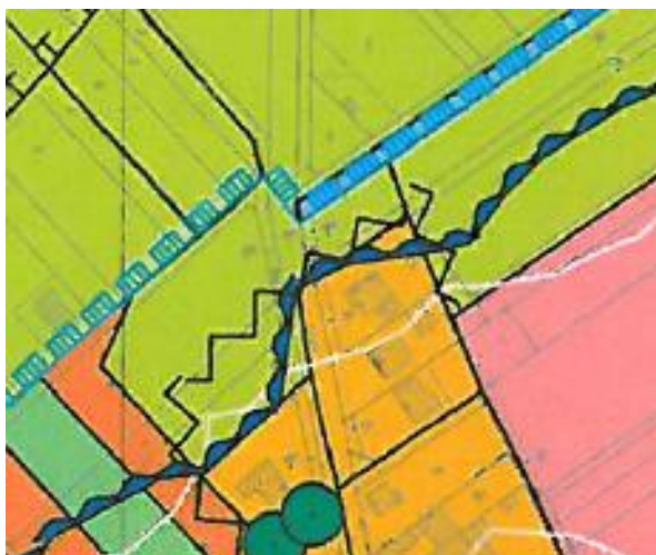
Ausschnitt FNP 2015