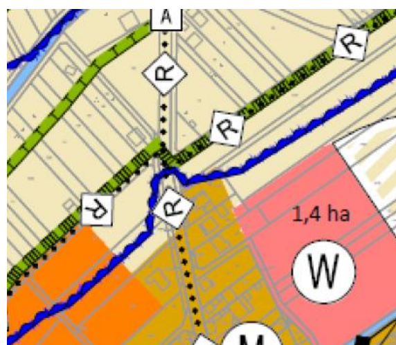
Vorentwurf FNP „Siedlungsentwicklung“

Mit der Fortschreibung „Siedlungsentwicklung“ sollte eine Sonderbaufläche im FNP gemäß den Planungen für den Mehrgenerationenplatz dargestellt werden. Die Änderung erfolgt parallel zum Bebauungsplanverfahren.